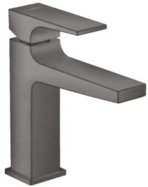
WT Armatur Hansgrohe Metropol Einhebel WT Mischer Brushed Black Chrome