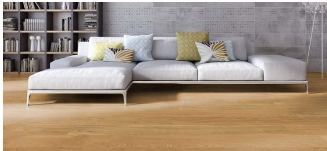
Weitzer Parkett WP Quadra 1800 Format 180x17,5cm