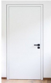
DANA- MONOLOG esche-weiss, Stumpfe Ausführung