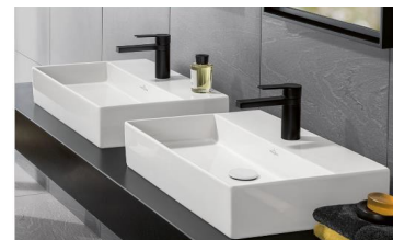
Villeroy&Boch Memento 2.0