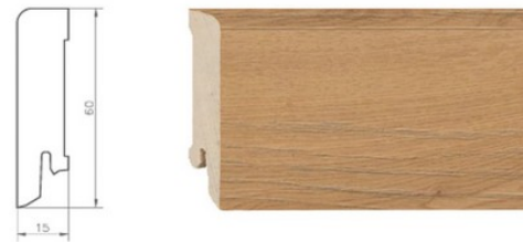
Sockelleisten 60mm – Eiche, in Parkettfarbe