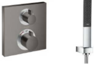
Hansgrohe EcostatSquare Brushed Black Chrome Hansgrohe Rainfinity Stabhandbrause Brushed Black Chrome