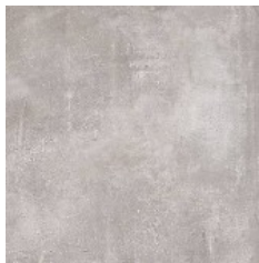
l'argilla Loft Serie Grey 120x120cm