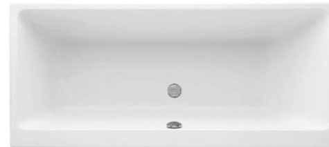
Villeroy&Boch Subway Acryl 180/80